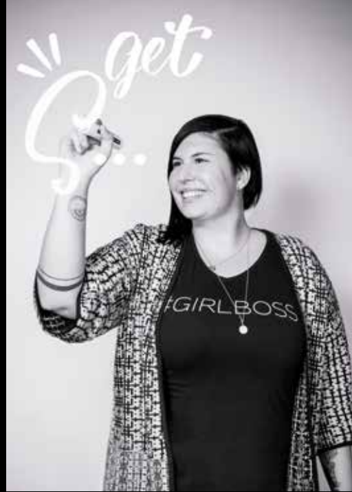
DESIGN & LETTERING „DESIGNSTANZE“

MIT MEINEM UNTERNEHMEN MÖCHTE ICH Menschen erreichen, die etwas zu sagen haben – auch auf einem Foto.